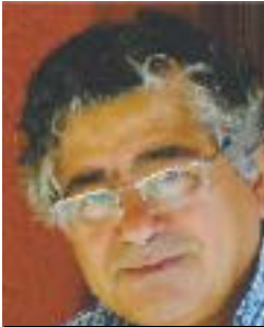
Por: Pepe Mejía, Desde Madrid

Vox, un partido nacido en las entrañas del golpismo, el franquismo y el fascismo en España, diseñando para cargarse la democracia, la